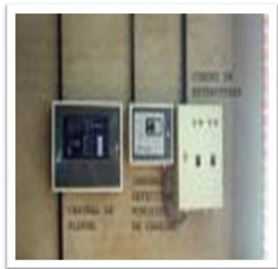
Detección de incendio con gases inertes. Consola de monitoreo y evacuación.