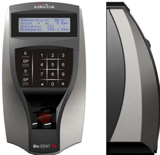
Lectores de huellas dactilares para control de presentismo.