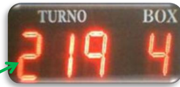
Asignación de turnos (turneros) para la atención